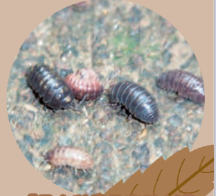
【昆虫科学教育館より】

ダンゴムシと呼んでいますが、実は昆虫の仲間ではなく、エビ、カニと同じ甲殻類の仲間。足の数には7対、14本あります。観察してみるとおもしろいですよ。